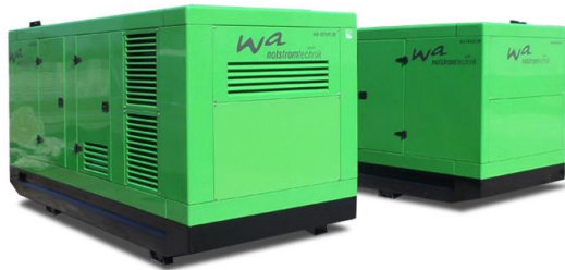
WA-D 500 Ausführung „S“ Schallgedämmtes Aggregat mit manueller Schaltanlage