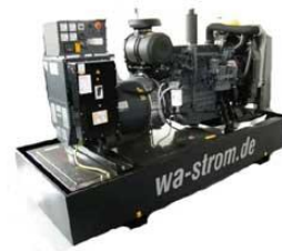
WA – D 250 Ausführung „G“ Grundrahmenaggregat mit manueller Schaltanlage & optionaler Ölauffangwanne

Die Kriterien für unsere Stromaggregate in diesen klassischen Einsatzkategorien sind sehr hoch: Hohe spezifische Leistungen bei gleichzeitig langen Wartungsintervallen, Dauerbetriebsfestigkeit auch bei häufigen Lastwechseln sowie eine hohe Startzuverlässigkeit, um nur einige Beispiele zu nennen.