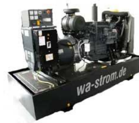
WA-D 500 Ausführung „S“ Schallgedämmtes Aggregat mit manueller Schaltanlage