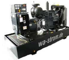
WA – D 250 Ausführung „G“ Grundrahmenaggregat mit manueller Schaltanlage & optionaler Ölaufangwanne

Die Kriterien für unsere Stromaggregate in diesen klassischen Einsatzkategorien sind sehr hoch: Hohe spezifische Leistungen bei gleichzeitig langen Wartungsintervallen, Dauerbetriebsfestigkeit auch bei häufigen Lastwechseln sowie eine hohe Startzuverlässigkeit, um nur einige Beispiele zu nennen.