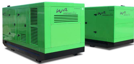
WA-D 500 Ausführung „S“ Schallgedämmtes Aggregat mit manueller Schaltanlage